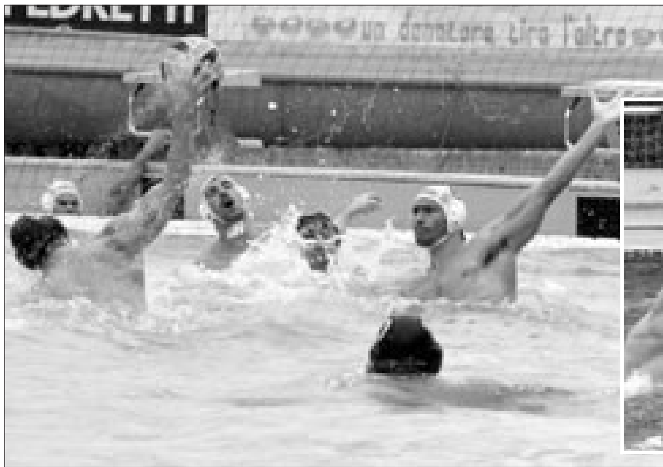
SOTTO LA PIOGGIA Alcune istantanee della sfida di ieri pomeriggio alle «Piscine Latina»